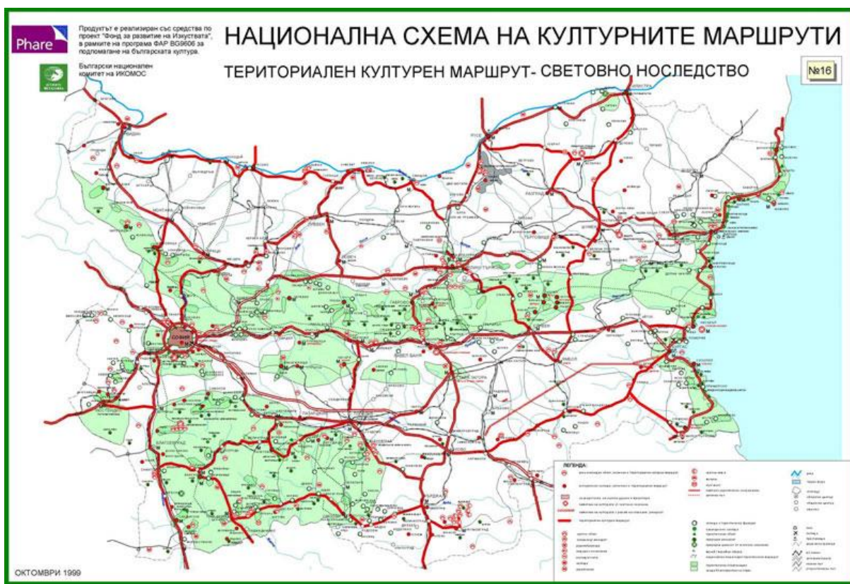
Фигура 2. Национална схема на културни маршрути в Р България.

Червената църква е включена като обект на културен маршрут в приетият от Министерски съвет Стратегически план за развитието на културния туризъм в България.